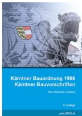
Kärntner Bauordnung 1996 / Kärntner Bauvorschriften Ladenpreis: 28,00EUR