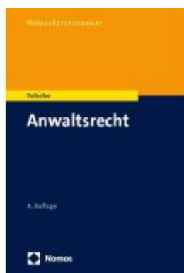
Anwaltsrecht Ladenpreis: 30,80EUR