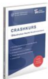
CRASHKURS Öffentliches Recht - Niedersachsen Ladenpreis: 27,70EUR