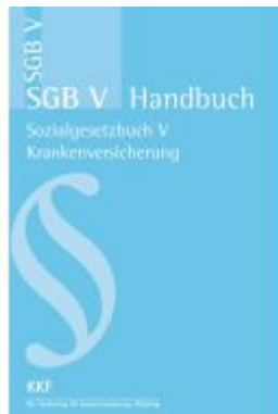
SGB V Handbuch Ladenpreis: 58,50EUR

Wir haben andere Produkte gefunden, die Ihnen gefallen könnten!