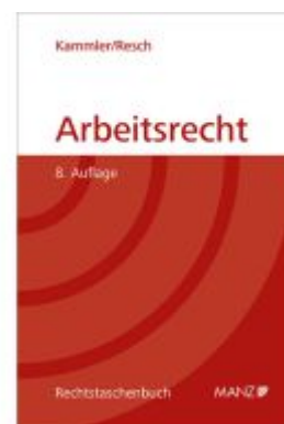
Arbeitsrecht Ladenpreis: 54,30EUR