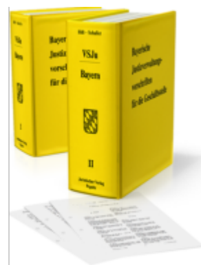
Bayerische Justizverwaltungsvorschriften für die Geschäftsstelle Ladenpreis: 133,70EUR