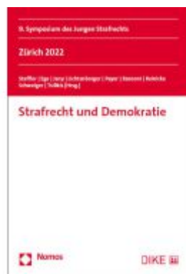
Strafrecht und Demokratie Ladenpreis: 50,40EUR