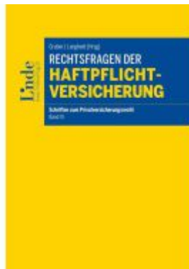
Rechtsfragen der Haftpflichtversicherung Ladenpreis: 58,00EUR