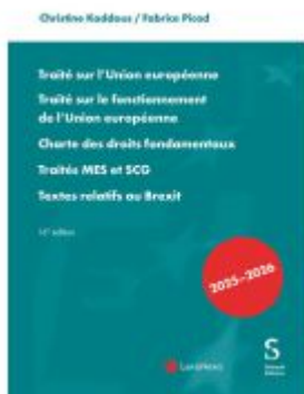
Traité sur l'Union européenne. Traité sur le fonctionnement de l'Union européenne, Charte des droits fondamentaux, Traités MES et SCG, Textes relatifs au Brexit Ladenpreis: 81,20EUR