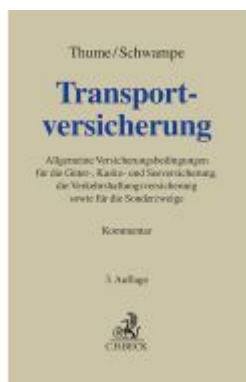
Transportversicherung Ladenpreis: 297,10EUR