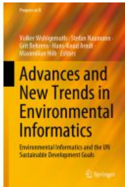
Advances and New Trends in Environmental Informatics Ladenpreis: 197,99EUR