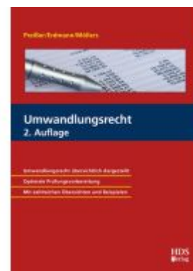
Umwandlungsrecht Ladenpreis: 51,30EUR