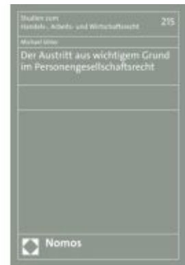
Der Austritt aus wichtigem Grund im Personengesellschaftsrecht Ladenpreis: 65,80EUR