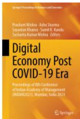
Digital Economy Post COVID-19 Era Ladenpreis: 197,99EUR

Wir haben andere Produkte gefunden, die Ihnen gefallen könnten!