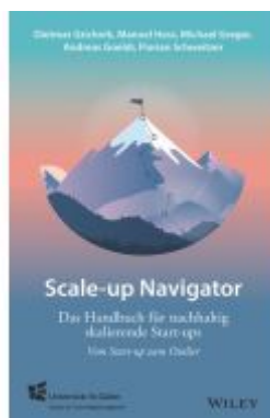
Scale-up Navigator Ladenpreis: 36,00EUR