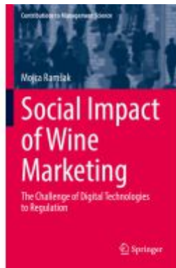
Social Impact of Wine Marketing Ladenpreis: 62,69EUR