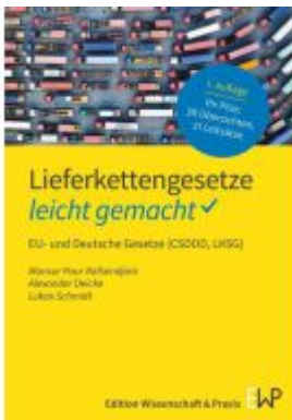
Lieferkettengesetze – leicht gemacht Ladenpreis: 17,40EUR