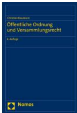
Öffentliche Ordnung und Versammlungsrecht Ladenpreis: 101,80EUR