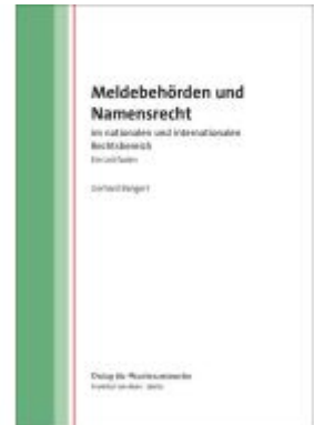
Meldebehörden und Namensrecht Ladenpreis: 35,60EUR