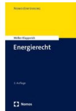
Energierrecht Ladenpreis: 30,80EUR