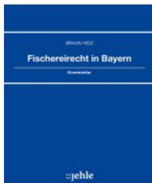
Fischereirecht in Bayern Ladenpreis: 177,90EUR