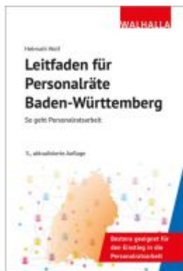
Leitfaden für Personalräte Baden- Württemberg Ladenpreis: 36,00EUR