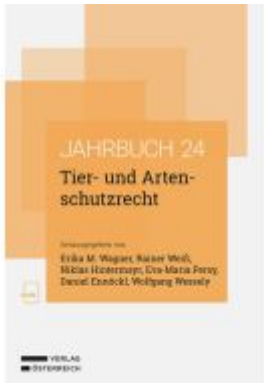
Tier- und Artenschutzrecht Ladenpreis: 84,00EUR