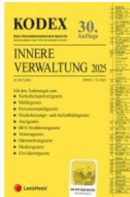
KODEX Innere Verwaltung 2025 - inkl. App Ladenpreis: 103,00EUR