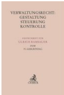
Verwaltungsrecht: Gestaltung, Steuerung, Kontrolle Ladenpreis: 153,20EUR