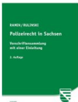
Polizeirecht in Sachsen Ladenpreis: 22,60EUR