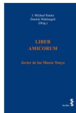
LIBER AMICORUM Ladenpreis: 44,00EUR