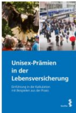
Unisex-Prämien in der Lebensversicherung Ladenpreis: 30,00EUR