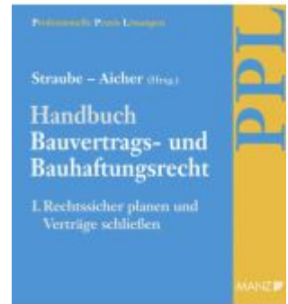
PAKET: Handbuch Bauvertrags- und Bauhaftungsrecht Band I: Rechtssicher Planen Ladenpreis: 199,00EUR