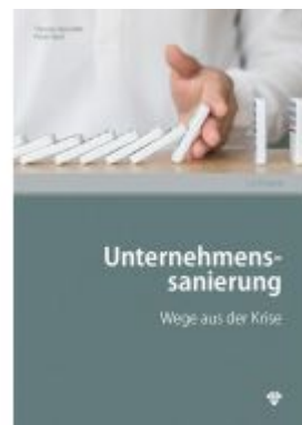
Unternehmenssanierung Ladenpreis: 31,90EUR