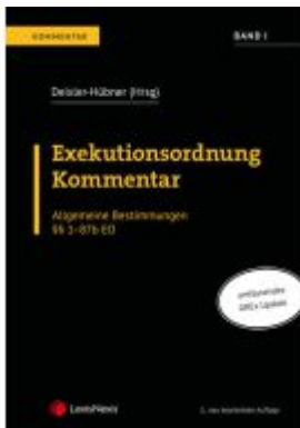
Exekutionsordnung Kommentar - Band I Ladenpreis: 196,00EUR