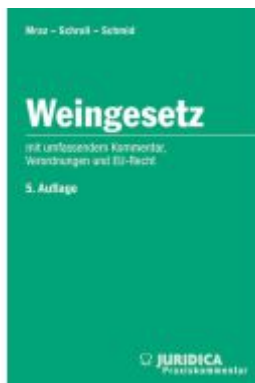
Weingesezt 5.Auflage Ladenpreis: 150,00EUR