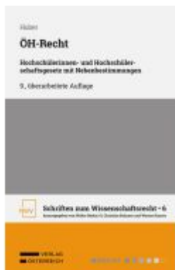
ÖH-Recht Ladenpreis: 68,00EUR