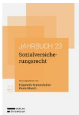
Sozialversicherungsrecht Ladenpreis: 68,00EUR