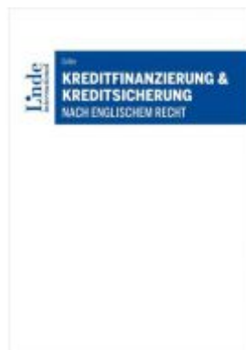
Kreditfinanzierung & Kreditsicherung nach englischem Recht Ladenpreis: 89,00 EUR