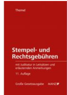
Stempel- und Rechtsgebühren Ladenpreis: 138,00 EUR