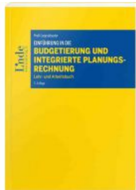
Einführung in die Budgetierung und integrierte Planungsrechnung Ladenpreis: 36,00 EUR