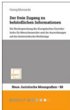
Der freie Zugang zu behördlichen Informationen Ladenpreis: 68,00 EUR