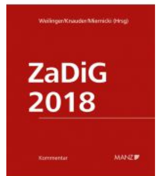
ZaDiG 2018 Ladenpreis: 259,00 EUR