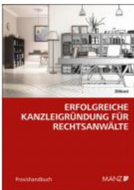
Erfolgreiche Kanzleigründung für Rechtsanwälte Ladenpreis: 34,00 EUR