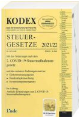
KODEX Steuergesetze 2021/22 Ladenpreis: 39,00 EUR