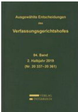
Ausgewählte Entscheidungen des Verfassungsgerichtshofes Ladenpreis: 299,00 EUR