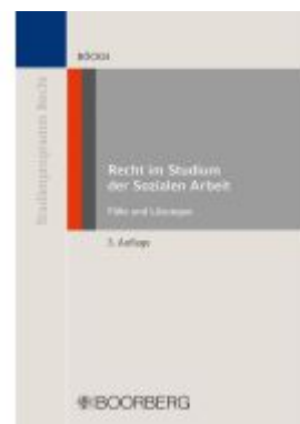
Recht im Studium der Sozialen Arbeit Ladenpreis: 25,50EUR