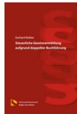
Steuerliche Gewinnermittlung aufgrund doppelter Buchführung Ladenpreis: 25,70EUR