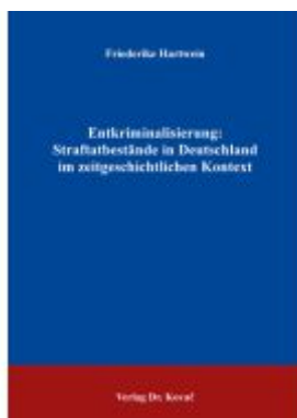
Entkriminalisierung: Straftatbestände in Deutschland im zeitgeschichtlichen Kontext Ladenpreis: 91,40EUR