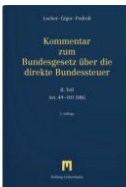
Kommentar zum Bundesgesetz über die direkte Bundessteuer Ladenpreis: 438,00EUR