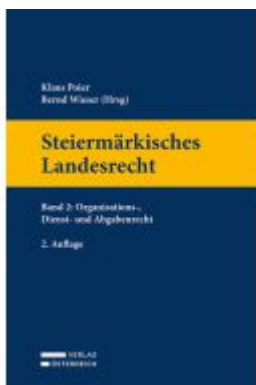
Steiermärkisches Landesrecht Ladenpreis: 99,00EUR