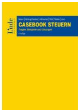
Casebook Steuern Ladenpreis: 72,00EUR