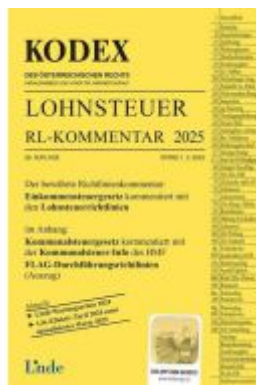
KODEX Lohnsteuer Richtlinien-Kommentar 2025 Ladenpreis: 64,00EUR