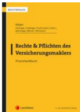
Rechte und Pflichten des Versicherungsmaklers Ladenpreis: 69,00EUR