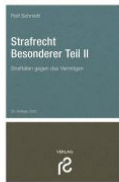
Strafrecht Besonderer Teil II Ladenpreis: 27,60EUR