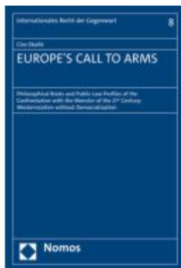
EUROPE'S CALL TO ARMS Ladenpreis: 50,40EUR