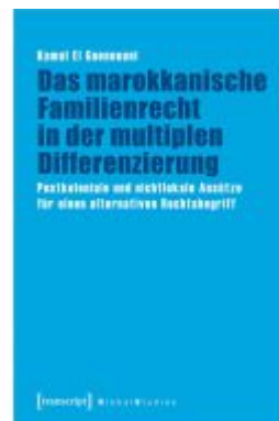
Das marokkanische Familienrecht in der multiplen Differenzierung Ladenpreis: 48,00EUR