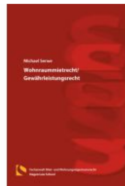
Wohnraummietrecht/Gewährleistungsrecht Ladenpreis: 25,70EUR