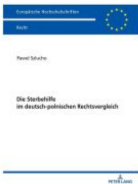
Die Sterbehilfe im deutsch-polnischen Rechtsvergleich Ladenpreis: 97,60EUR