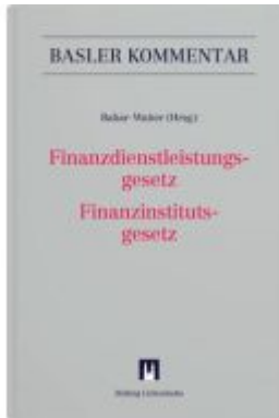
Finanzdienstleistungsgesetz/Finanzinstitutsgesetz Ladenpreis: 493,00EUR