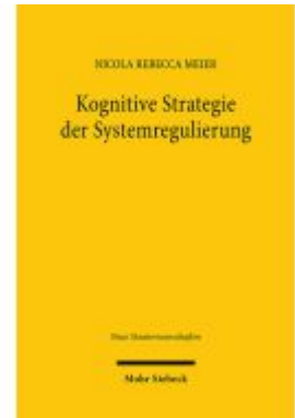
Kognitive Strategie der Systemregulierung Ladenpreis: 81,30EUR