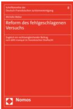
Reform des fehlgeschlagenen Versuchs Ladenpreis: 65,80EUR