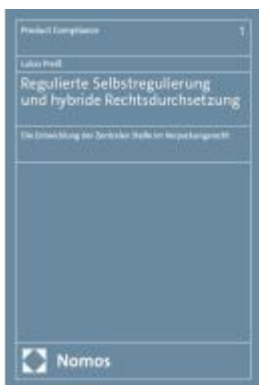
Regulierte Selbstregulierung und hybride Rechtsdurchsetzung Ladenpreis: 101,80EUR