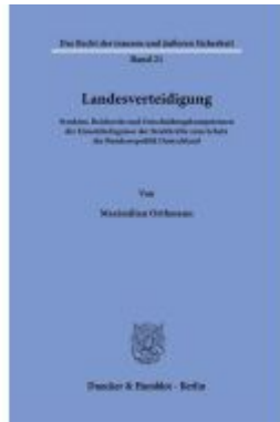
Landesverteidigung. Ladenpreis: 113,00EUR