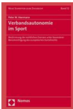
Verbandsautonomie im Sport Ladenpreis: 255,00EUR