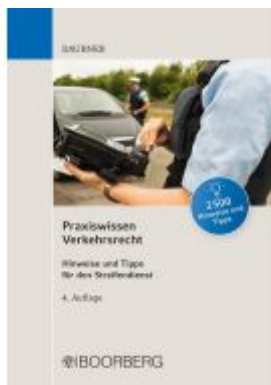
Praxiswissen Verkehrsrecht Ladenpreis: 25,50EUR