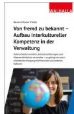
Von fremd zu bekannt - Aufbau interkultureller Kompetenz in der Verwaltung Ladenpreis: 56,50EUR