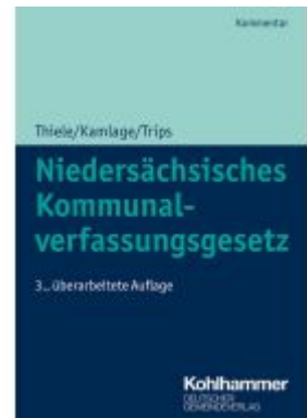
Niedersächsisches Kommunalverfassungsgesetz Ladenpreis: 50,40EUR