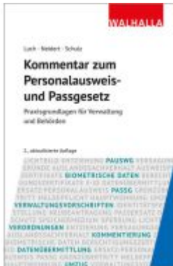
Kommentar zum Personalausweis- und Passgesetz Ladenpreis: 72,00EUR

Wir haben andere Produkte gefunden, die Ihnen gefallen könnten!