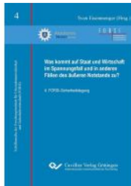
Was kommt auf Staat und Wirtschaft im Spannungsfeld und in anderen Fällen des äußeren Notstands zu? Ladenpreis: 14,80EUR