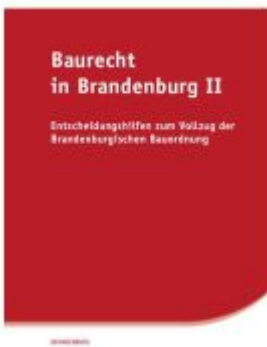
Baurecht in Brandenburg II Ladenpreis: 15,40EUR