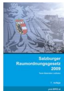
Salzburger Raumordnungsgesetz 2009 Ladenpreis: 32,00EUR