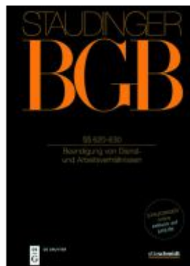
§§ 620-630 Ladenpreis: 289,00EUR