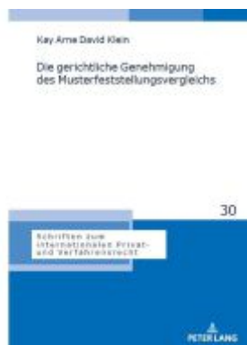
Die gerichtliche Genehmigung des Musterfeststellungsvergleichs Ladenpreis: 66,80EUR