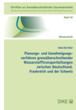
Planungs- und Genehmigungsverfahren grenzüberschreitender Wasserstofftransportleitungen zwischen Deutschland, Frankreich und der Schweiz Ladenpreis: 58,00EUR