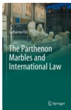
The Parthenon Marbles and International Law Ladenpreis: 175,99EUR