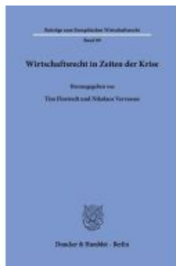
Wirtschaftsrecht in Zeiten der Krise Ladenpreis: 92,50EUR