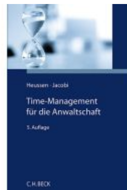
Time-Management für die Anwaltschaft Ladenpreis: 56,60EUR