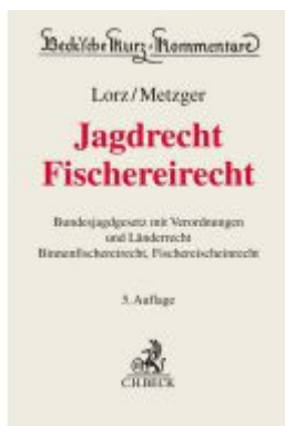
Jagdrecht, Fischereirecht Ladenpreis: 112,10EUR