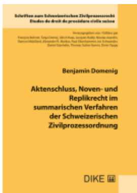
Aktenchluss, Noven- und Replikrecht im summarischen Verfahren der Schweizerischen Zivilprozessordnung Ladenpreis: 86,00EUR