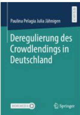
Deregulierung des Crowdlendings in Deutschland Ladenpreis: 102,80EUR