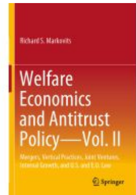
Welfare Economics and Antitrust Policy — Vol. II Ladenpreis: 65,99EUR