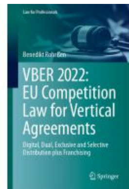
VBER 2022: EU Competition Law for Vertical Agreements Ladenpreis: 109,99EUR