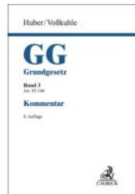
Grundgesetz Bd. 3: Artikel 83-146 Ladenpreis: 297,10EUR