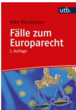
Fälle zum Europarecht Ladenpreis: 25,60EUR