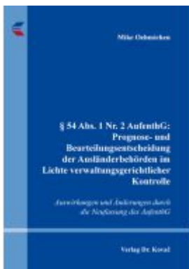
§ 54 Abs. 1 Nr. 2 AufenthG: Prognose- und Beurteilungsentscheidung der Ausländerbehörden im Lichte verwaltungsgerichtlicher Kontrolle Ladenpreis: 101,60EUR