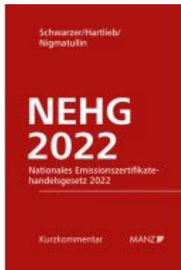
Nationales Emissionszertifikatehandelsgesetz 2022 NEHG 2022 Ladenpreis: 84,00EUR

Wir haben andere Produkte gefunden, die Ihnen gefallen könnten!