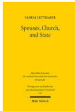
Spouses, Church, and State Ladenpreis: 117,20EUR