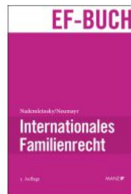
Internationales Familienrecht Ladenpreis: 94,00EUR