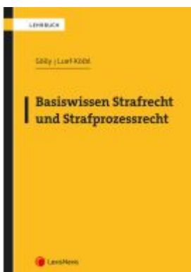
Basiswissen Strafrecht und Strafprozessrecht Ladenpreis: 39,00EUR