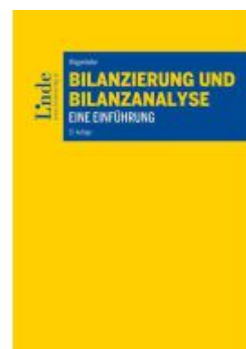
Bilanzierung und Bilanzanalyse Ladenpreis: 58,00EUR