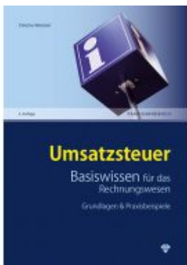
Umsatzsteuer Basiswissen für das Rechnungswesen Ladenpreis: 44,00EUR

Wir haben andere Produkte gefunden, die Ihnen gefallen könnten!