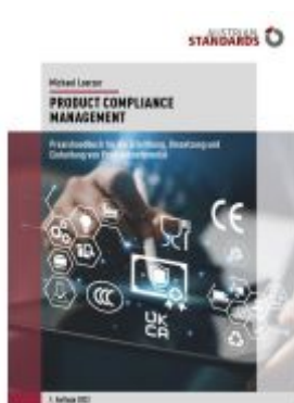
Product Compliance Management Ladenpreis: 75,90EUR