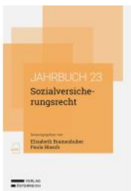
Sozialversicherungsrecht Ladenpreis: 68,00EUR