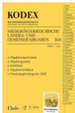
KODEX NÖ Landes- und Gemeindeabgaben Ladenpreis: 26,00EUR