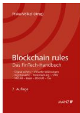
Blockchain rules Das FinTech-Handbuch Ladenpreis: 198,00EUR