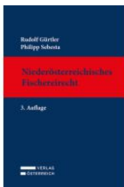
Niederösterreichisches Fischereirecht Ladenpreis: 89,10EUR