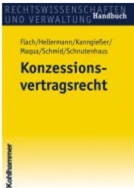
Konzessionsvertragsrecht Ladenpreis: 61,70EUR