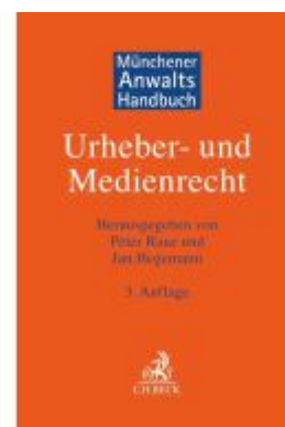
Münchener Anwalts handbuch Urheber- und Medienrecht Ladenpreis: 235,50EUR