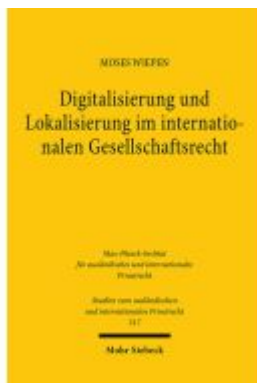
Digitalisierung und Lokalisierung im internationalen Gesellschaftsrecht Ladenpreis: 76,10EUR