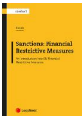
Sanctions: Financial Restrictive Measures Ladenpreis: 55,00EUR