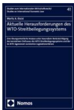
Aktuelle Herausforderungen des WTO- Streitbeilegungssystems Ladenpreis: 101,80EUR