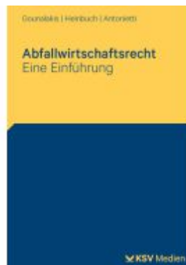
Abfallwirtschaftsrecht Ladenpreis: 30,90EUR