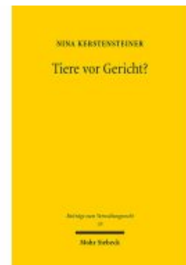
Tiere vor Gericht? Ladenpreis: 96,70EUR