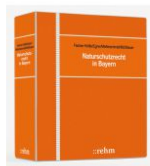
Naturschutzrecht in Bayern Ladenpreis: 225,20EUR