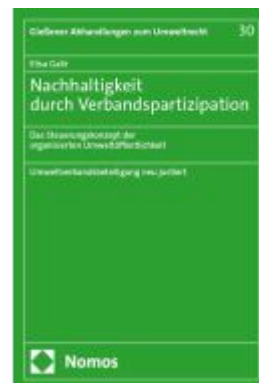
Nachhaltigkeit durch Verbandspartizipation Ladenpreis: 101,80EUR