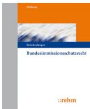
Bundesimmissionsschutzrecht - Entscheidungen Ladenpreis: 813,20EUR