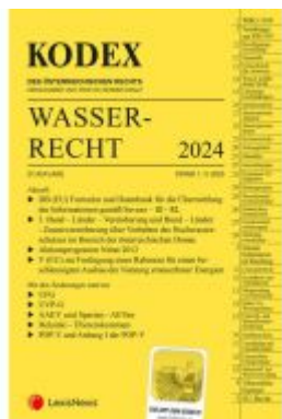
KODEX Wasserrecht 2023/24 - inkl. App Ladenpreis: 99,00EUR

Wir haben andere Produkte gefunden, die Ihnen gefallen könnten!