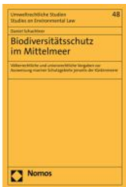
Biodiversitätsschutz im Mittelmeer Ladenpreis: 148,10EUR