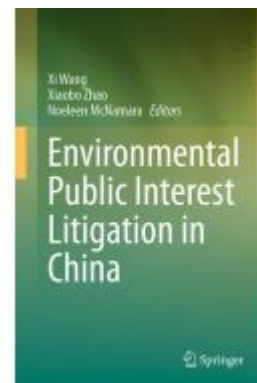
Environmental Public Interest Litigation in China Ladenpreis: 186,99EUR