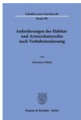
Anforderungen des Habitat- und Artenschutzrechts nach Vorhabenzulassung. Ladenpreis: 92,50EUR