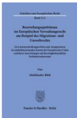
Beurteilungsspielräume im Europäischen Verwaltungsrecht am Beispiel des Migrations- und Umweltrechts. Ladenpreis: 102,70EUR