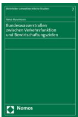
Bundeswasserstraßen zwischen Verkehrsfunktion und Bewirtschaftungszielen Ladenpreis: 101,80EUR