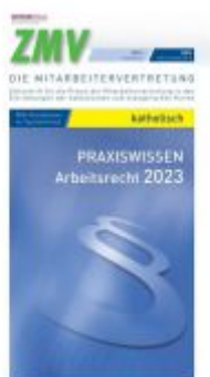
ZMV Praxiswissen Arbeitsrecht 2023 katholisch Ladenpreis: 13,30EUR