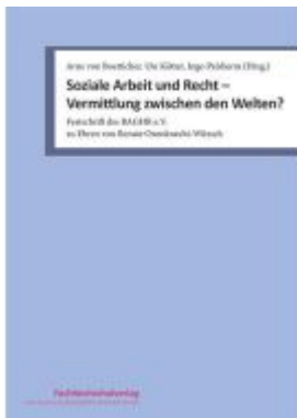
Soziale Arbeit und Recht – Vermittlung zwischen den Welten? Ladenpreis: 34,00EUR