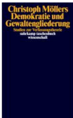
Demokratie und Gewaltengliederung Ladenpreis: 28,80EUR