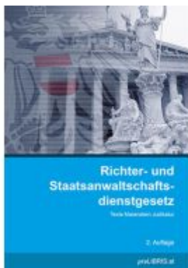
Richter- und Staatsanwaltschaftsdienstgesetz Ladenpreis: 31,00EUR