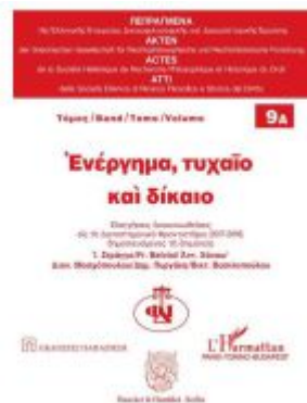
Άκτις, Ζυγαριά και Δίκαιο Ladenpreis: 61,70EUR