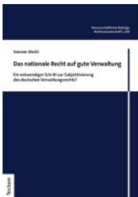
Das nationale Recht auf gute Verwaltung Ladenpreis: 91,50EUR