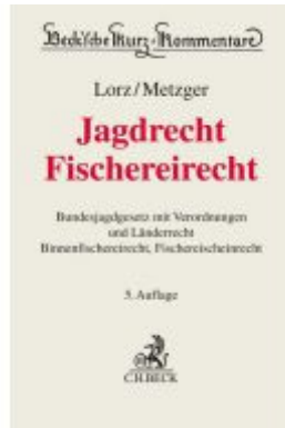
Jagdrecht, Fischereirecht Ladenpreis: 112,10EUR