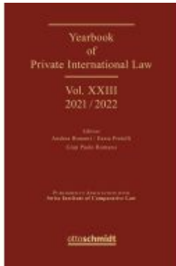
Yearbook of Private International Law Vol. XXIII – 2021/2022 Ladenpreis: 266,30EUR