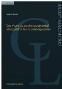
Les vices du pacte successoral abdicatif et leurs conséquences Ladenpreis: 75,00EUR