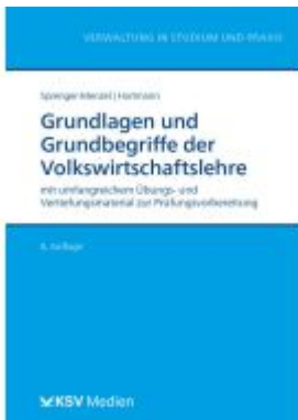
Grundlagen und Grundbegriffe der Volkswirtschaftslehre Ladenpreis: 26,80EUR