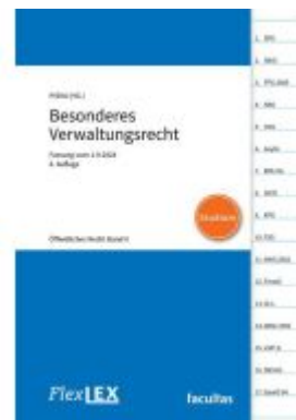
FlexLex Besonderes Verwaltungsrecht – Öffentliches Recht Band II | Studium Ladenpreis: 28,00EUR