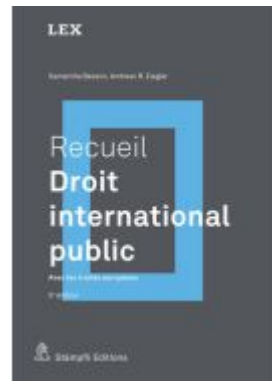
Recueil : Droit international public Ladenpreis: 151,70EUR