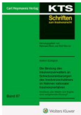
Die Bindung des Insolvenzverwalters Ladenpreis: 91,50EUR