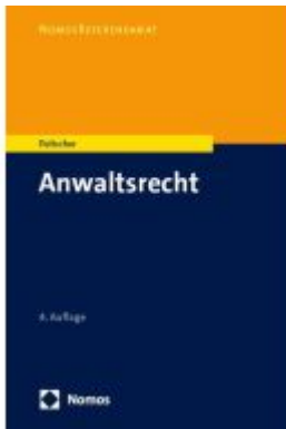
Anwaltsrecht Ladenpreis: 30,80EUR