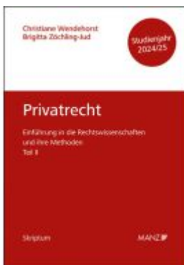
Privatrecht Einführung in die Rechtswissenschaften und ihre Methoden: Teil II Ladenpreis: 15,90EUR