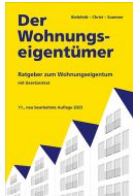
Der Wohnungseigentümer Ladenpreis: 71,90EUR