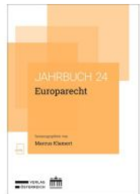
Jahrbuch Europarecht 2024 Ladenpreis: 86,40EUR