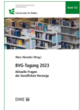
BVG-Tagung 2023 Ladenpreis: 58,00EUR