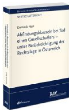
Abfindungsklauseln bei Tod eines Gesellschafters - unter Berücksichtigung der Rechtslage in Österreich Ladenpreis: 91,50EUR