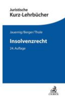
Insolvenzrecht Ladenpreis: 24,60EUR