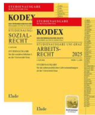
KODEX-Paket Studienausgabe Arbeits- und Sozialrecht Graz 2025 Ladenpreis: 22,00EUR