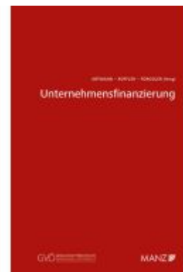
Unternehmensfinanzierung Ladenpreis: 44,00EUR