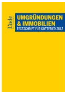
Umgründungen und Immobilien Ladenpreis: 65,00EUR