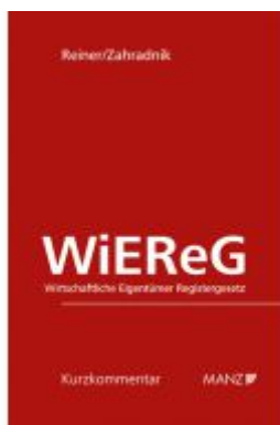
Wirtschaftliche Eigentümer Registergesetz WiReG Ladenpreis: 98,00EUR