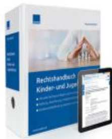
Rechtshandbuch Kinder- und Jugendschutz Ladenpreis: 239,80EUR