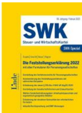
SWK-Spezial Die Feststellungserklärung 2022 Ladenpreis: 49,00EUR