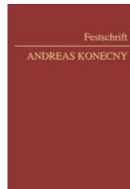
Festschrift Konecny Ladenpreis: 178,00EUR