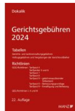
Gerichtsgebühren 2024 Tabellen und Richtlinien Ladenpreis: 42,00EUR