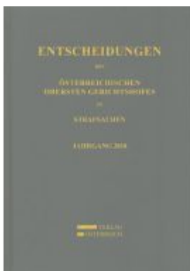
Entscheidungen des Österreichischen Obersten Gerichtshofes in Strafsachen Ladenpreis: 164,00EUR