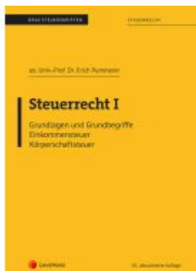
Steuerrecht I (Skriptum) Ladenpreis: 22,50EUR

Wir haben andere Produkte gefunden, die Ihnen gefallen könnten!