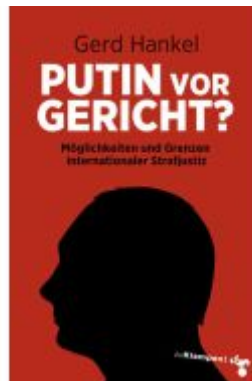
Putin vor Gericht? Ladenpreis: 14,40EUR