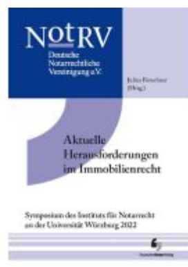
Aktuelle Herausforderungen im Immobilienrecht Ladenpreis: 49,90EUR