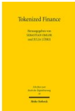
Tokenized Finance Ladenpreis: 96,70EUR

Wir haben andere Produkte gefunden, die Ihnen gefallen könnten!