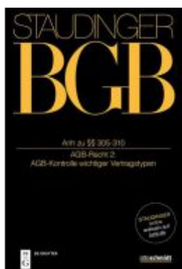
Anh zu §§ 305-310 Ladenpreis: 439,00EUR