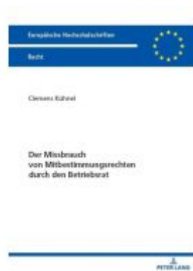
Der Missbrauch von Mitbestimmungsrechten durch den Betriebsrat Ladenpreis: 41,10EUR