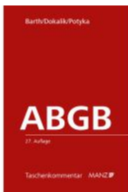
Das Allgemeine bürgerliche Gesetzbuch ABGB Ladenpreis: 134,00EUR