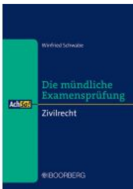
Zivilrecht Ladenpreis: 20,40EUR