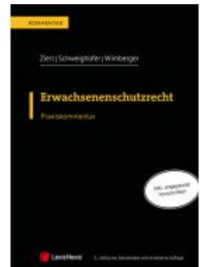
Erwachsenenschutzrecht Ladenpreis: 129,00EUR