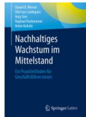
Nachhaltiges Wachstum im Mittelstand Ladenpreis: 39,05EUR