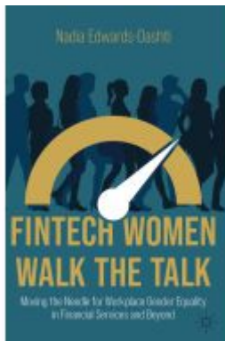
FinTech Women Walk the Talk Ladenpreis: 43,99EUR

Wir haben andere Produkte gefunden, die Ihnen gefallen könnten!