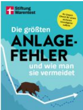
Die größten Anlagefehler und wie man sie vermeidet Ladenpreis: 23,60EUR