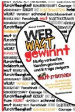
Wer wagt, gewinnt Ladenpreis: 19,97EUR