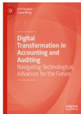
Digital Transformation in Accounting and Auditing Ladenpreis: 186,99EUR