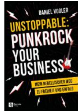
Unstoppable: Punkrock your Business Ladenpreis: 31,99EUR