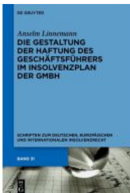
Die Gestaltung der Haftung des Geschäftsführers im Insolvenzplan der GmbH Ladenpreis: 89,95EUR