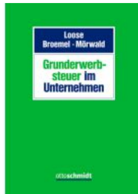
Grunderwerbsteuer im Unternehmen Ladenpreis: 173,80EUR