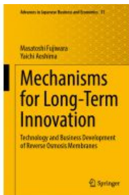
Mechanisms for Long-Term Innovation Ladenpreis: 175,99EUR