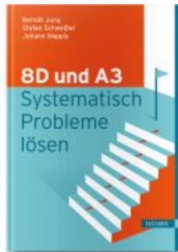
8D und A3 – Systematisch Probleme lösen Ladenpreis: 41,20EUR