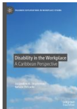
Disability in the Workplace Ladenpreis: 164,99EUR