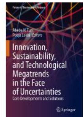
Innovation, Sustainability, and Technological Megatrends in the Face of Uncertainties Ladenpreis: 65,99EUR