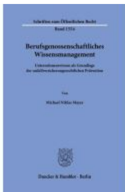
Berufsgenossenschaftliches Wissensmanagement Ladenpreis: 113,00EUR