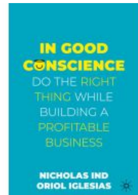
In Good Conscience Ladenpreis: 41,79EUR