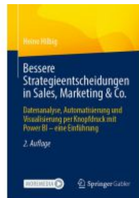
Bessere Strategieentscheidungen in Sales, Marketing & Co. Ladenpreis: 56,53EUR