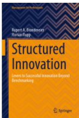
Structured Innovation Ladenpreis: 93,49EUR