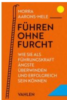
Führen ohne Furcht Ladenpreis: 27,70EUR