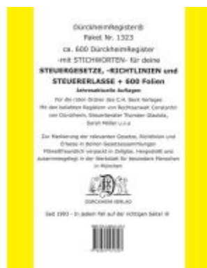
DürckheimRegister® Paket- STEUERGESetze-RILI-ERLASSE: 600 DürckheimRegister® mit STICHWORTEN + 600 FOLIEN Ladenpreis: 85,00EUR