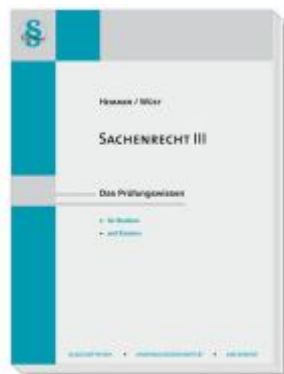
Sachenrecht III Ladenpreis: 22,50EUR