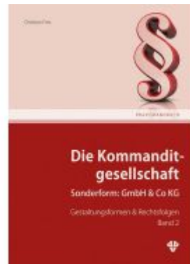
Die Kommanditgesellschaft Band 2 Ladenpreis: 52,00EUR