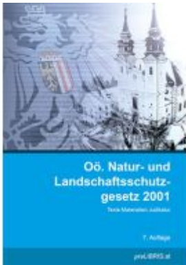
Öö. Natur- und Landschaftsschutzgesetz 2001 Ladenpreis: 28,00EUR