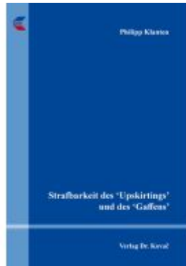
Strafbarkeit des 'Upskirtings' und des 'Gaffens' Ladenpreis: 101,60EUR