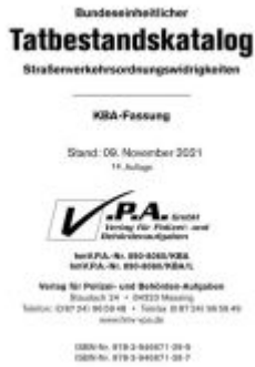
15. Ergänzung zum Bundes einheitlichen Tatbestandskatalog, KBA-Langfassung, Stand 01. September 2023 Ladenpreis: 30,80EUR