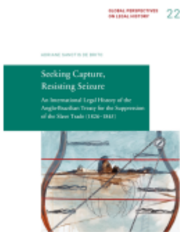
Seeking Capture, Resisting Seizure Ladenpreis: 19,50EUR