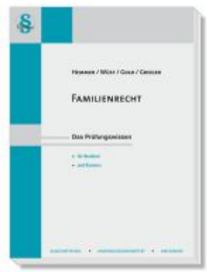
Familienrecht Ladenpreis: 22,50EUR