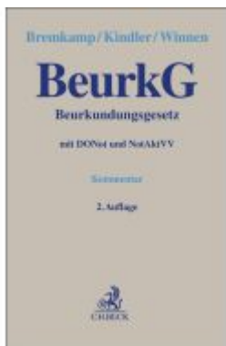
Beurkundungsgesetz Ladenpreis: 144,00EUR

Wir haben andere Produkte gefunden, die Ihnen gefallen könnten!