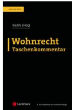
Wohnrecht Taschenkommentar Ladenpreis: 229,00EUR