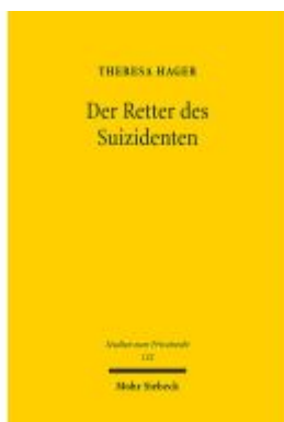
Der Retter des Suizidenten Ladenpreis: 91,50EUR