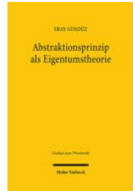
Abstraktionsprinzip als Eigentumstheorie Ladenpreis: 50,40EUR