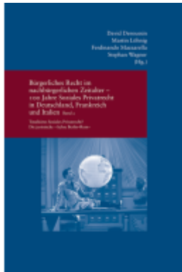
Bürgerliches Recht im nachbürgerlichen Zeitalter - 100 Jahre Soziales Privatrecht in Deutschland, Frankreich und Italien Ladenpreis: 91,50EUR