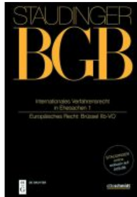
Internationales Verfahrensrecht in Ehesachen I Ladenpreis: 159,95EUR