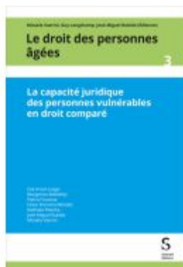
La capacité juridique des personnes vulnérables en droit comparé Ladenpreis: 88,30EUR