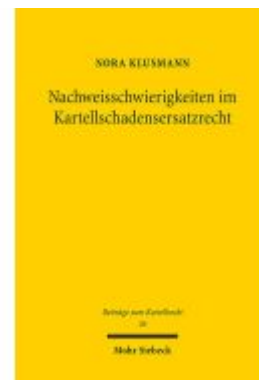
Nachweisschwierigkeiten im Kartellschadensersatzrecht Ladenpreis: 81,30EUR