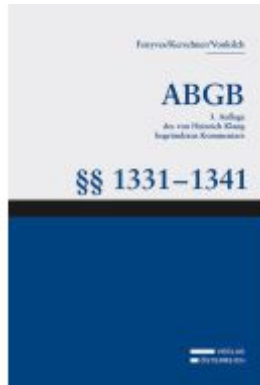
Großkommentar zum ABGB - Klang Kommentar Ladenpreis: 208,00EUR