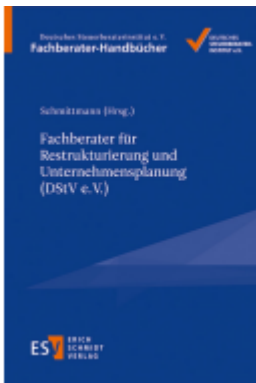
Fachberater für Restrukturierung und Unternehmensplanung (DStV e.V.) Ladenpreis: 256,00EUR