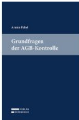
Grundfragen der AGB-Kontrolle Ladenpreis: 43,00EUR