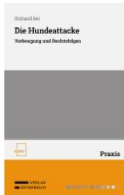
Die Hundeeatcke Ladenpreis: 48,00EUR