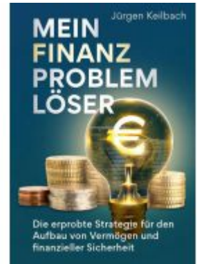
Mein Finanzproblemlöser Ladenpreis: 28,70EUR