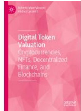
Digital Token Valuation Ladenpreis: 164,99EUR