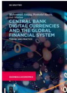
Central Bank Digital Currencies and the Global Financial System Ladenpreis: 54,95EUR