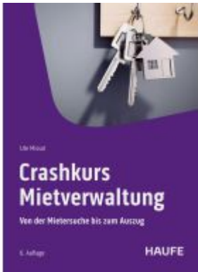
Crashkurs Mietverwaltung Ladenpreis: 41,20EUR