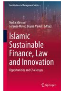
Islamic Sustainable Finance, Law and Innovation Ladenpreis: 241,99EUR