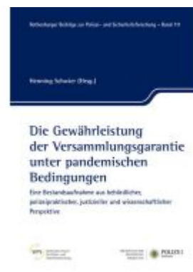
Die Gewährleistung der Versammlungsgarantie unter pandemischen Bedingungen Ladenpreis: 15,50EUR