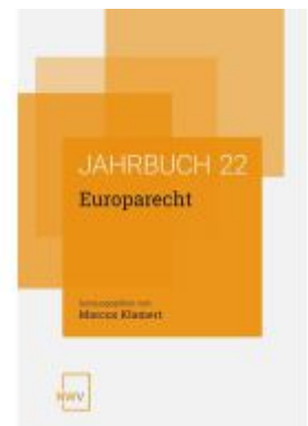
Jahrbuch Europarecht 2021 Ladenpreis: 80,20EUR