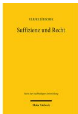
Suffizienz und Recht Ladenpreis: 107,00EUR