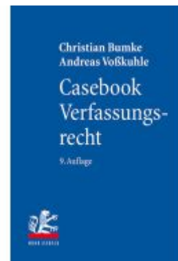
Casebook Verfassungsrecht Ladenpreis: 45,30EUR