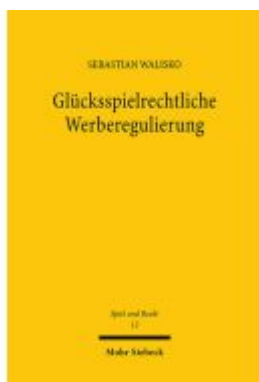
Glücksspielrechtliche Werberegulierung Ladenpreis: 76,10EUR