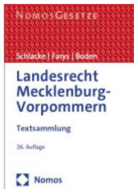
Landesrecht Mecklenburg-Vorpommern Ladenpreis: 30,80EUR