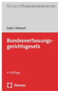
Bundesverfassungsgerichtsgesetz Ladenpreis: 153,20EUR