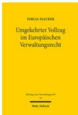
Umgekehrter Vollzug im Europäischen Verwaltungsrecht Ladenpreis: 107,00EUR

Wir haben andere Produkte gefunden, die Ihnen gefallen könnten!