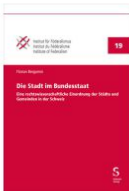
Die Stadt im Bundesstaat Ladenpreis: 108,20EUR