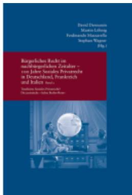
Bürgerliches Recht im nachbürgerlichen Zeitalter - 100 Jahre Soziales Privatrecht in Deutschland, Frankreich und Italien

Wir haben andere Produkte gefunden, die Ihnen gefallen könnten!