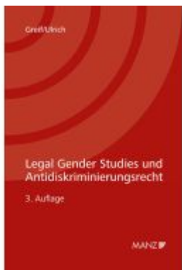
Legal Gender Studies und Antidiskriminierungsrecht