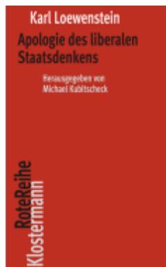
Apologie des liberalen Staatsdenkens