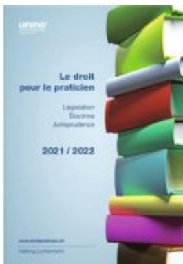
Le droit pour le praticien 2021/2022 Ladenpreis: 87,00EUR