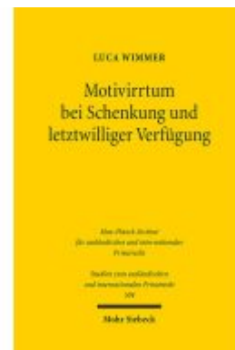
Motivirrtum bei Schenkung und letztwilliger Verfügung Ladenpreis: 76,10EUR