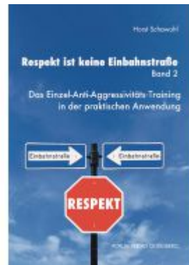
Respekt ist keine Einbahnstraße, Band 2