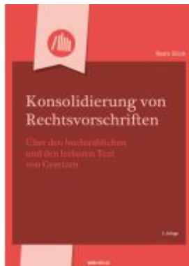
Konsolidierung von Rechtsvorschriften