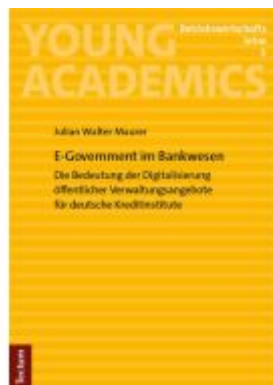
E-Government im Bankwesen Ladenpreis: 29,90EUR