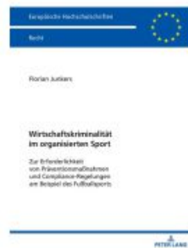
Wirtschaftskriminalität im organisierten Sport Ladenpreis: 66,80EUR