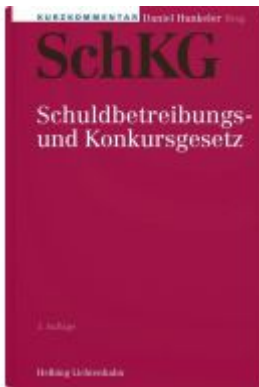
Kurzkommentar SchKG Ladenpreis: 361,00EUR