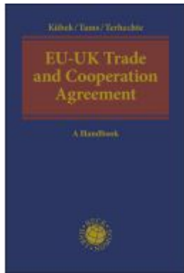
EU-UK Trade and Cooperation Agreement Ladenpreis: 226,20EUR