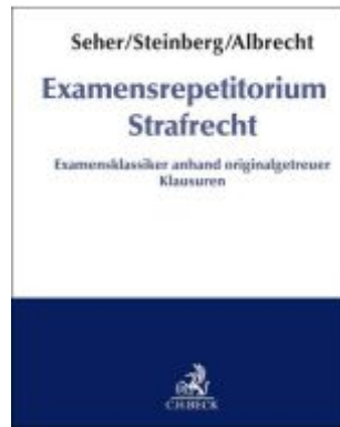
Examensrepetitorium Strafrecht Ladenpreis: 46,30EUR