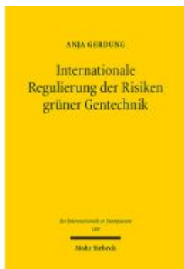
Internationale Regulierung der Risiken grüner Gentechnik Ladenpreis: 122,40EUR