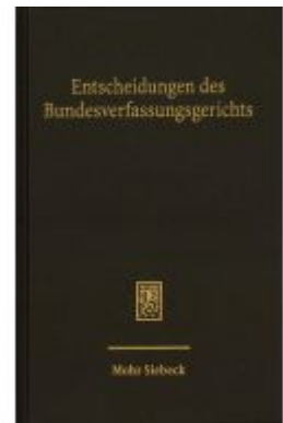
Entscheidungen des Bundesverfassungsgerichts (BVerfGE) Ladenpreis: 55,60EUR