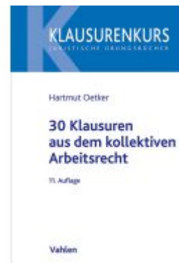
30 Klausuren aus dem kollektiven Arbeitsrecht Ladenpreis: 25,60EUR