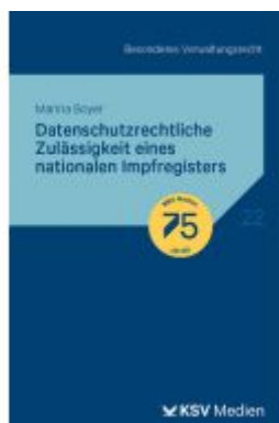
Datenschutzrechtliche Zulässigkeit eines nationalen Impfregisters Ladenpreis: 20,60EUR