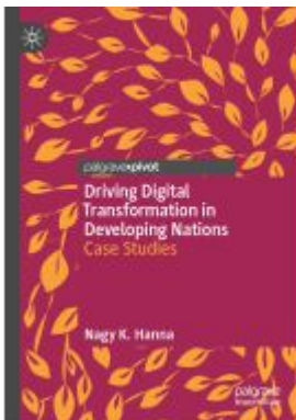
Driving Digital Transformation in Developing Nations Ladenpreis: 43,99EUR

Wir haben andere Produkte gefunden, die Ihnen gefallen könnten!