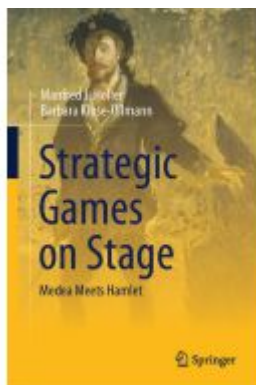
Strategic Games on Stage Ladenpreis: 131,99EUR