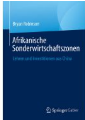
Afrikanische Sonderwirtschaftszonen Ladenpreis: 113,07EUR