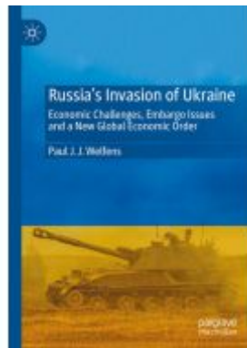
Russia's Invasion of Ukraine Ladenpreis: 142,99EUR