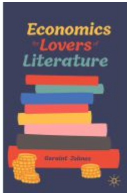
Economics for Lovers of Literature Ladenpreis: 27,49EUR