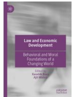
Law and Economic Development Ladenpreis: 186,99EUR