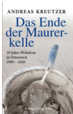
Das Ende der Maurerkelle Ladenpreis: 29,70EUR