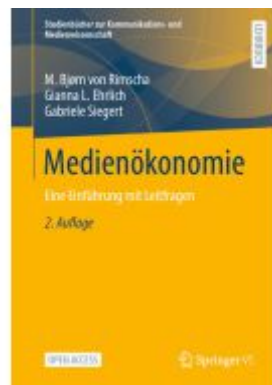
Medienökonomie Ladenpreis: 43,99EUR