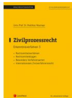
Zivilprozessrecht Erkenntnisverfahren 3 (Skriptum) Ladenpreis: 22,50EUR