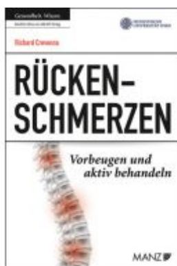
Rückenschmerzen Vorbeugen und aktiv behandeln Ladenpreis: 23,90EUR