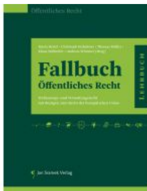
SET Fallbuch Öffentliches Recht und Besonderes Verwaltungsrecht 3 Ladenpreis: 78,00EUR

Wir haben andere Produkte gefunden, die Ihnen gefallen könnten!