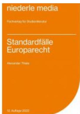
Standardfälle Europarecht - 2022 Ladenpreis: 13,30EUR