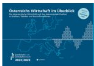
Österreichs Wirtschaft im Überblick 2022/23 Ladenpreis: 14,30EUR