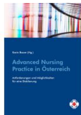
Advanced Nursing Practice in Österreich Ladenpreis: 14,90EUR