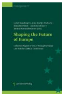
Shaping the Future of Europe Ladenpreis: 74,00EUR