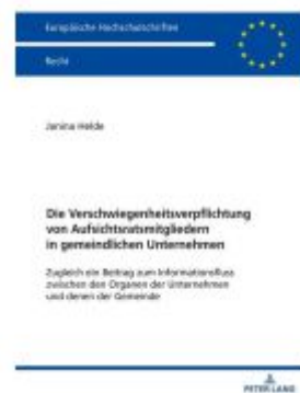
Die Verschwiegenheitsverpflichtung von Aufsichtsratsmitgliedern in gemeindlichen Unternehmen