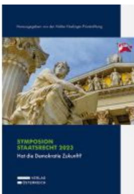
Symposium Staatsrecht 2023