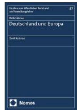
Deutschland und Europa Ladenpreis: 91,50EUR