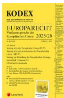
KODEX EU-Verfassungsrecht (Europarecht)