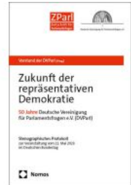
Zukunft der repräsentativen Demokratie Ladenpreis: 29,90EUR