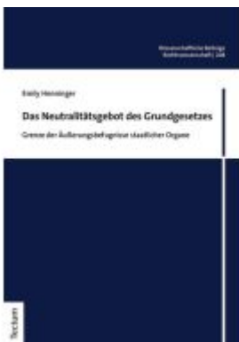
Das Neutralitätsgebot des Grundgesetzes Ladenpreis: 55,60EUR