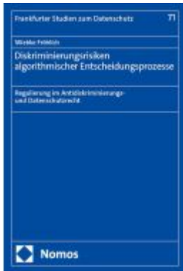
Diskriminierungsrisiken algorithmischer Entscheidungsprozesse Ladenpreis: 71,00EUR