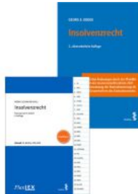
Kombipaket Insolvenzrecht und FlexLex Insolvenzrecht | Studium Ladenpreis: 47,00EUR