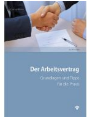
Der Arbeitsvertrag Ladenpreis: 33,00EUR