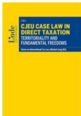
CJEU Case Law in Direct Taxation: Territoriality and Fundamental Freedoms Ladenpreis: 82,00EUR