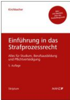
Einführung in das Strafprozessrecht Ladenpreis: 30,20EUR