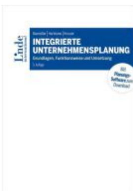
Integrierte Unternehmensplanung Ladenpreis: 65,00EUR