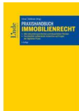
Praxishandbuch Immobilienrecht Ladenpreis: 120,00EUR