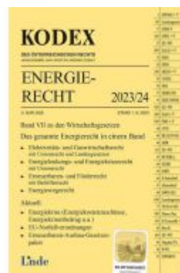
KODEX Energierecht 2023/24 Ladenpreis: 69,00EUR