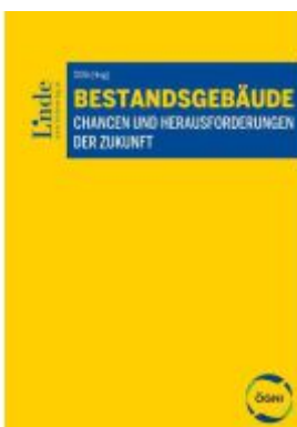
Bestandsgebäude Ladenpreis: 89,00EUR