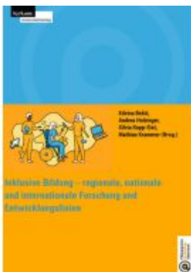
Inklusive Bildung - regionale, nationale und internationale Forschung und Entwicklungslinien Ladenpreis: 31,00EUR