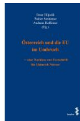
Österreich und die EU im Umbruch – eine Nachlese zur Festschrift für Heinrich Neisser Ladenpreis: 86,00EUR