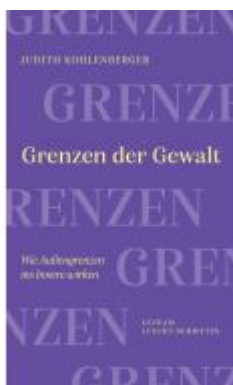
Grenzen der Gewalt Ladenpreis: 16,50EUR