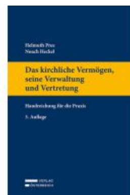
Das kirchliche Vermögen, seine Verwaltung und Vertretung Ladenpreis: 79,00EUR