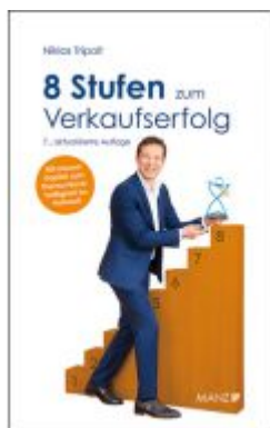
8 Stufen zum Verkaufserfolg Ladenpreis: 24,90EUR