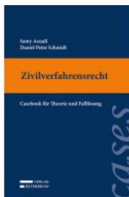
Zivilverfahrensrecht Ladenpreis: 39,00EUR