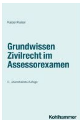
Grundwissen Zivilrecht im Assessorexamen Ladenpreis: 38,10EUR