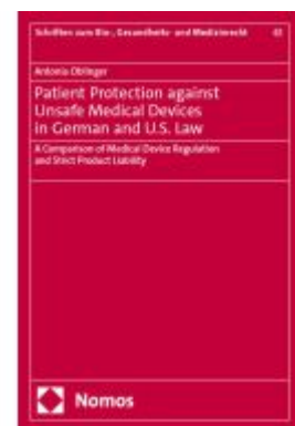
Patient Protection against Unsafe Medical Devices in German and U.S. Law Ladenpreis: 204,60EUR