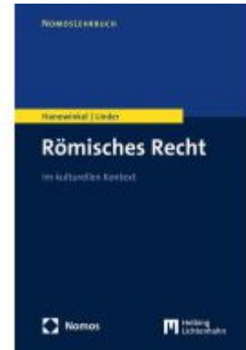
Römisches Recht Ladenpreis: 24,00EUR