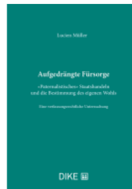
Aufgedrängte Fürsorge Ladenpreis: 184,00EUR