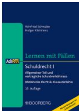
Schuldrecht I Ladenpreis: 23,20EUR