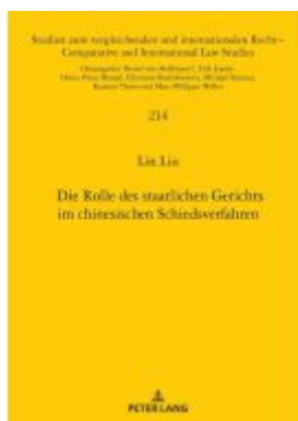
Die Rolle des staatlichen Gerichts im chinesischen Schiedsverfahren Ladenpreis: 71,90EUR