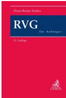
RVG für Anfänger Ladenpreis: 54,50EUR