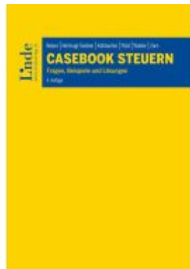
Casebook Steuern Ladenpreis: 72,00EUR