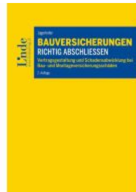
Bauversicherungen richtig abschließen Ladenpreis: 64,00EUR