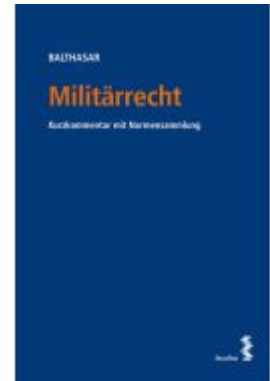
Militärrecht Ladenpreis: 58,00EUR