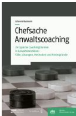
Chefsache Anwaltscoaching Ladenpreis: 83,00EUR