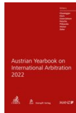
Austrian Yearbook on International Arbitration 2022