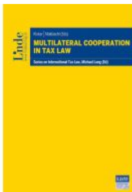
Multilateral Cooperation in Tax Law