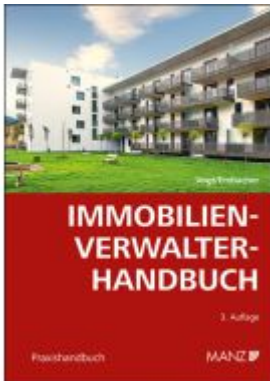
Immobilienverwalter-Handbuch Ladenpreis: 58,00EUR