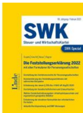
SWK-Spezial Die Feststellungserklärung 2022