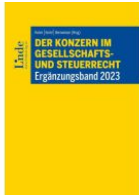
Der Konzern im Gesellschafts- und Steuerrecht | Ergänzungsband 2023 Ladenpreis: 48,00EUR