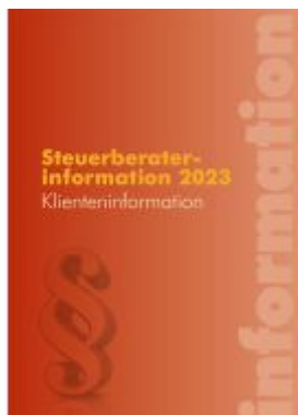
Steuerberaterinformation 2023 Ladenpreis: 49,50EUR