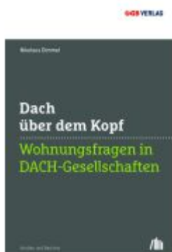
Dach über dem Kopf Ladenpreis: 36,00EUR