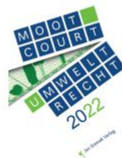
Moot Court Umweltrecht 2022 Ladenpreis: 55,00EUR