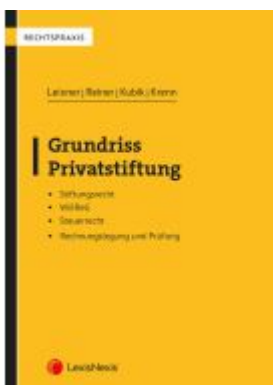
Grundriss Privatstiftung Ladenpreis: 29,00EUR