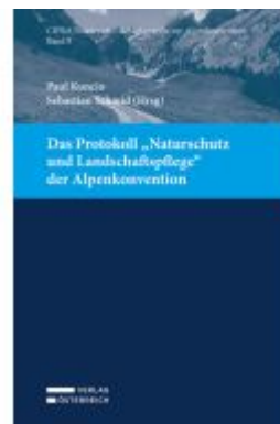
Das Protokoll „Naturschutz und Landschaftspflege“ der Alpenkonvention Ladenpreis: 48,00EUR