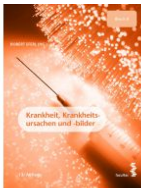
Krankheit, Krankheitsursachen und -bilder Ladenpreis: 36,90EUR