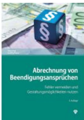
Abrechnung von Beendigungsansprüchen Ladenpreis: 29,70EUR