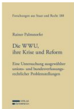
Die WWU, ihre Krise und Reform Ladenpreis: 149,00EUR