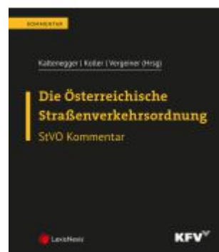
Die Österreichische Straßenverkehrsordnung Ladenpreis: 362,00EUR