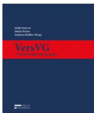
VersVG - Versicherungsvertragsgesetz Ladenpreis: 259,00 EUR