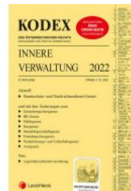
KODEX Innere Verwaltung 2022 - inkl. App Ladenpreis: 99,00 EUR