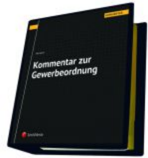
Kommentar zur Gewerbeordnung Ladenpreis: 455,00 EUR