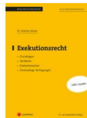
Exekutionsrecht (Skriptum) Ladenpreis: 21,00 EUR