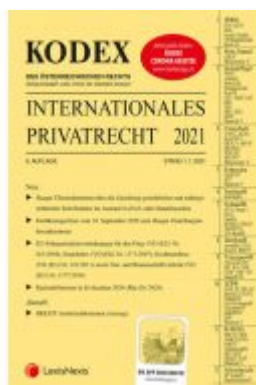
KODEX Internationales Privatrecht 2021 - inkl. App Ladenpreis: 34,00 EUR