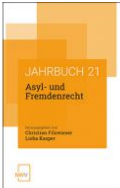
Asyl- und Fremdenrecht Ladenpreis: 78,00 EUR