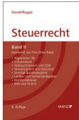
Grundriss des österreichischen Steuerrechts Ladenpreis: 64,00 EUR