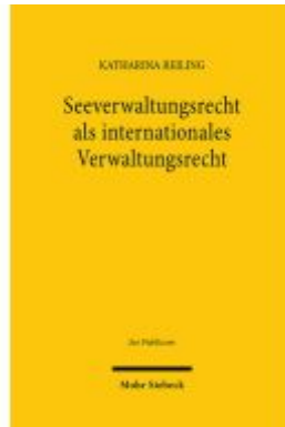
Seeverwaltungsrecht als internationales Verwaltungsrecht Ladenpreis: 142,90EUR