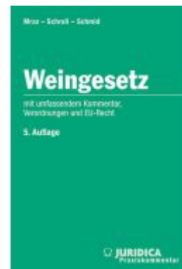
Weingesetz 5. Auflage