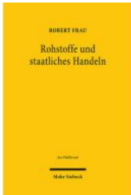
Rohstoffe und staatliches Handeln Ladenpreis: 138,80EUR