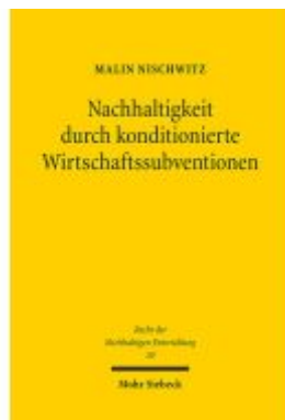
Nachhaltigkeit durch konditionierte Wirtschaftssubventionen