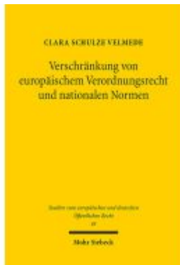
Verschränkung von europäischem Verordnungsrecht und nationalen Normen