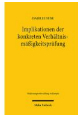
Implikationen der konkreten Verhältnismäßigkeitsprüfung