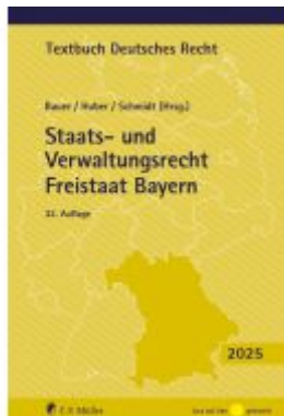
Staats- und Verwaltungsrecht Freistaat Bayern