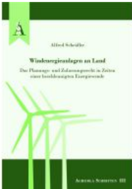
Windenergieanlagen an Land Ladenpreis: 67,90EUR