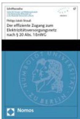
Der effiziente Zugang zum Elektrizitätsversorgungsnetz nach § 20 Abs. 1 EnWG