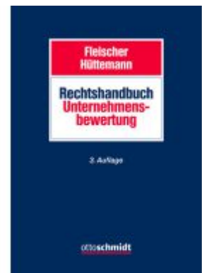
Rechtshandbuch Unternehmensbewertung Ladenpreis: 235,50EUR