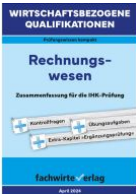
Wirtschaftsbezogene Qualifikationen: Rechnungswesen Ladenpreis: 12,40EUR