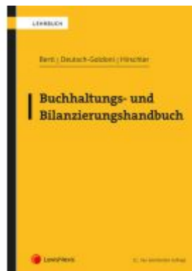
Buchhaltungs- und Bilanzierungshandbuch Ladenpreis: 86,00EUR