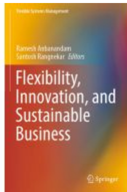
Flexibility, Innovation, and Sustainable Business Ladenpreis: 109,99EUR