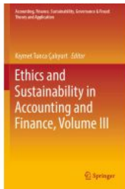
Ethics and Sustainability in Accounting and Finance, Volume III Ladenpreis: 175,99EUR