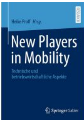
New Players in Mobility Ladenpreis: 185,04EUR