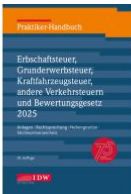
Praktiker-Handbuch Erbschaftsteuer, Grunderwerbsteuer, Kraftfahrzeugsteuer, andere Verkehrsteuern und Bewertungsgesetz 2025, 29. Auflage Ladenpreis: 71,00EUR