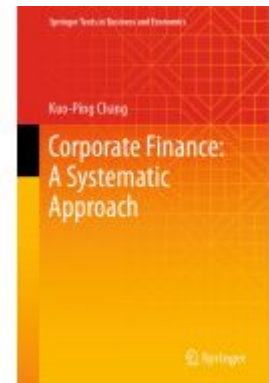
Corporate Finance: A Systematic Approach Ladenpreis: 175,99EUR