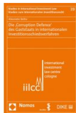
Die ,Corruption Defence' des Gaststaats in internationalen Investitionsschiedsverfahren Ladenpreis: 80,20 EUR