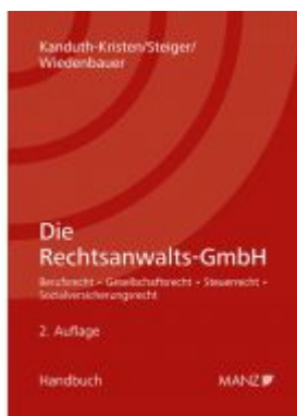
Die Rechtsanwalts-GmbH Ladenpreis: 48,00 EUR