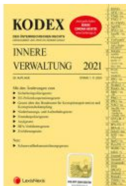
KODEX Innere Verwaltung 2021 Ladenpreis: 99,00 EUR