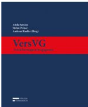
VersVG - Versicherungsvertragsgesetz Aktionspreis: 59,00 EUR Ladenpreis: 109,00 EUR