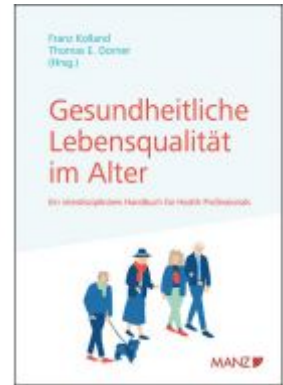
Gesundheitliche Lebensqualität im Alter Ladenpreis: 49,00 EUR