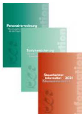
Steuerrechts-Paket 2021 Ladenpreis: 88,00 EUR