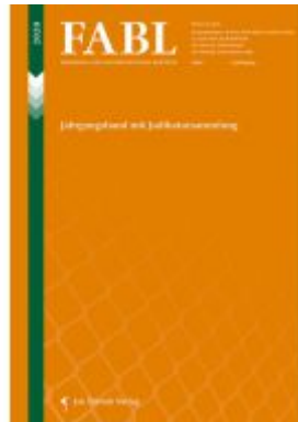
Fremden- und Asylrechtliche Blätter (FABL) Ladenpreis: 59,90 EUR