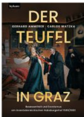
Der Teufel in Graz. Ladenpreis: 39,00 EUR

Wir haben andere Produkte gefunden, die Ihnen gefallen könnten!