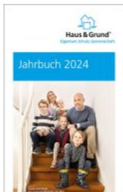
Jahrbuch 2024 Ladenpreis: 9,30EUR