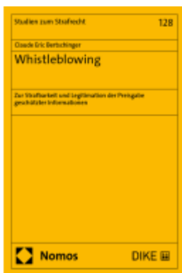
Whistleblowing Ladenpreis: 74,00EUR