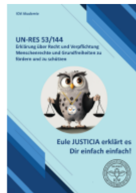
UN-RES 53/144 Ladenpreis: 30,80EUR