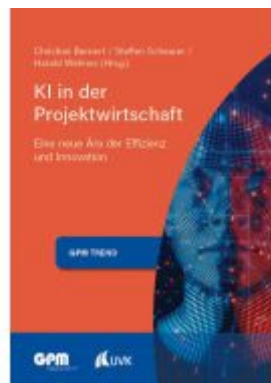
KI in der Projektwirtschaft 2 Ladenpreis: 51,40EUR