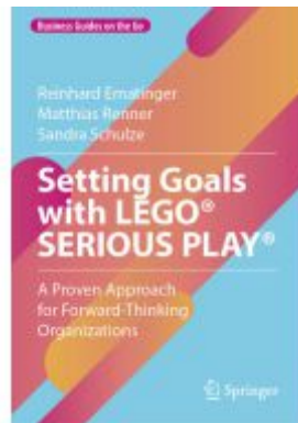
Setting Goals with LEGO® SERIOUS PLAY® Ladenpreis: 43,99EUR