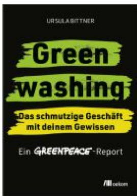
Greenwashing – das schmutzige Geschäft mit deinem Gewissen Ladenpreis: 24,70EUR