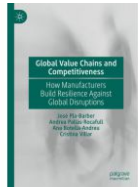
Global Value Chains and Competitiveness Ladenpreis: 164,99EUR