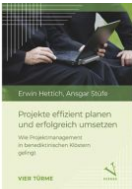
Projekte effizient planen und erfolgreich umsetzen Ladenpreis: 18,00EUR