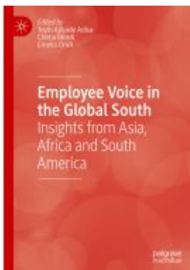
Employee Voice in the Global South Ladenpreis: 197,99EUR