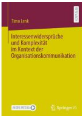
Interessenwidersprüche und Komplexität im Kontext der Organisationskommunikation Ladenpreis: 66,81EUR