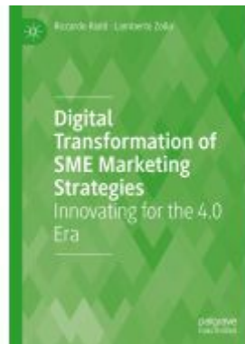
Digital Transformation of SME Marketing Strategies Ladenpreis: 164,99EUR