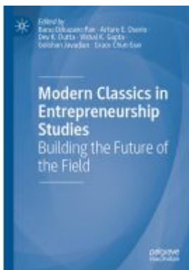
Modern Classics in Entrepreneurship Studies Ladenpreis: 120,99EUR