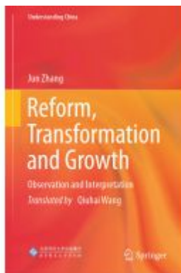
Reform, Transformation and Growth Ladenpreis: 142,99EUR