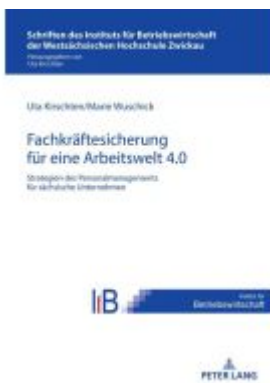
Strategien des Personalmanagements zur Fachkräftesicherung in sächsischen Unternehmen für eine Arbeitswelt 4.0 Ladenpreis: 61,60EUR