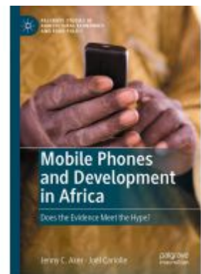
Mobile Phones and Development in Africa Ladenpreis: 142,99EUR