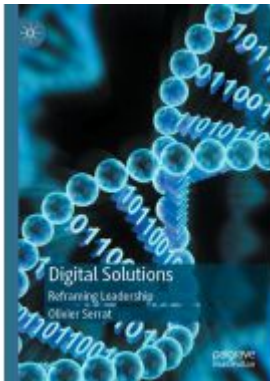
Digital Solutions Ladenpreis: 38,49EUR

Wir haben andere Produkte gefunden, die Ihnen gefallen könnten!