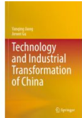
Technology and Industrial Transformation of China Ladenpreis: 142,99EUR