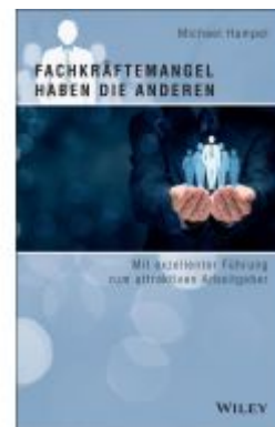
Fachkräftemangel haben die anderen Ladenpreis: 27,80EUR