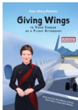
Giving Wings to Your Career as a Flight Attendant Ladenpreis: 12,99EUR