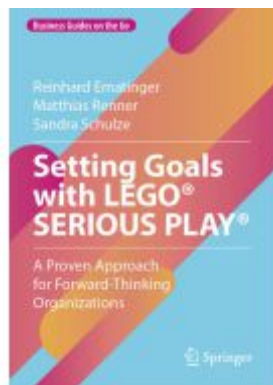
Setting Goals with LEGO® SERIOUS PLAY® Ladenpreis: 43,99EUR