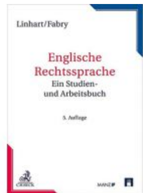
Englische Rechtssprache Ladenpreis: 35,90 EUR