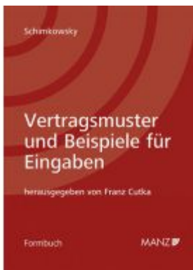
Vertragsmuster und Beispiele für Eingaben 9. Auflage Ladenpreis: 398,00 EUR