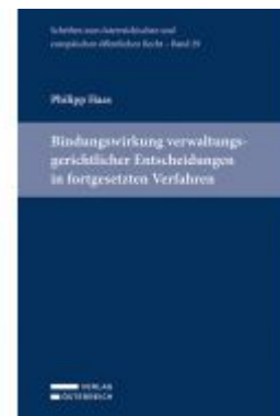
Bindungswirkung verwaltungsgerichtlicher Entscheidungen in fortgesetzten Verfahren Ladenpreis: 89,00 EUR