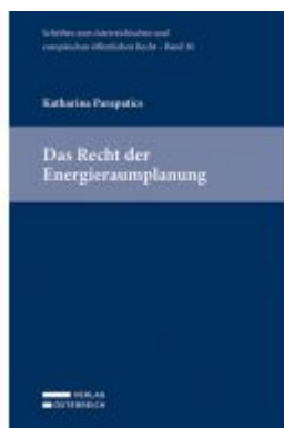
Das Recht der Energieräumplanung Ladenpreis: 109,00 EUR