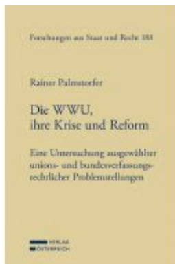
Die WWU, ihre Krise und Reform Ladenpreis: 149,00 EUR