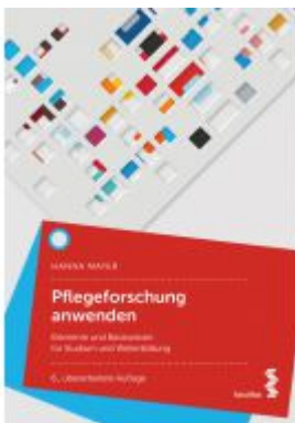
Pflegeforschung anwenden Ladenpreis: 39,90 EUR