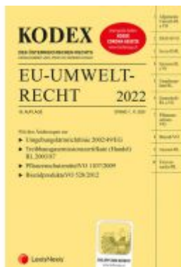
KODEX EU-Umweltrecht 2022 - inkl. App Ladenpreis: 103,00 EUR