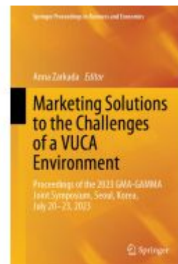
Marketing Solutions to the Challenges of a VUCA Environment Ladenpreis: 197,99EUR