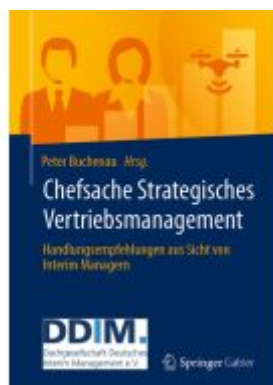
Chefsache Strategisches Vertriebsmanagement Ladenpreis: 41,11EUR