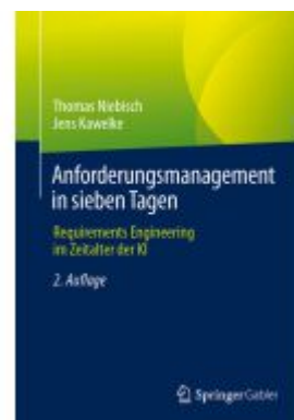
Anforderungsmanagement in sieben Tagen Ladenpreis: 51,39EUR