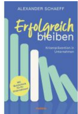
Erfolgreich bleiben Ladenpreis: 22,70EUR