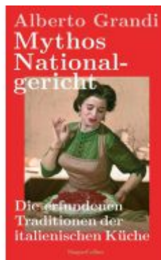
Mythos Nationalgericht. Die erfundenen Traditionen der italienischen Küche Ladenpreis: 22,70EUR