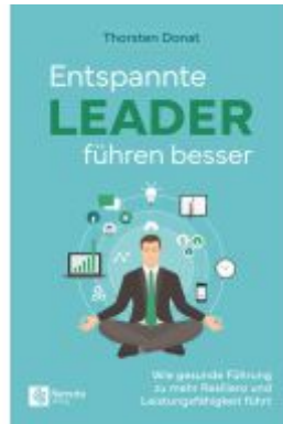
Entspannte Leader führen besser Ladenpreis: 26,99EUR