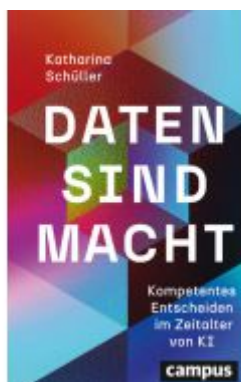
Daten sind Macht