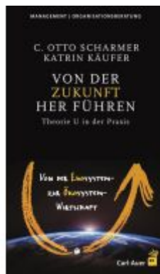
Von der Zukunft her führen Ladenpreis: 45,30EUR