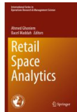
Retail Space Analytics Ladenpreis: 175,99EUR