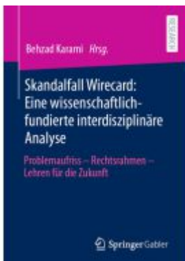
Skandalfall Wirecard: Eine wissenschaftlich-fundierte interdisziplinäre Analyse

Wir haben andere Produkte gefunden, die Ihnen gefallen könnten!