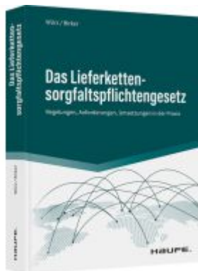
Das Lieferkettensorgfaltspflichtengesetz Ladenpreis: 82,20EUR