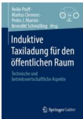
Induktive Taxiladung für den öffentlichen Raum Ladenpreis: 82,24EUR