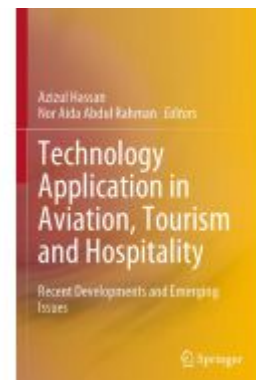
Technology Application in Aviation, Tourism and Hospitality