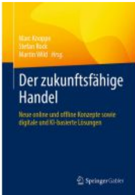
Der zukunftsfähige Handel Ladenpreis: 51,39EUR