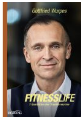
Fitnesslife Ladenpreis: 24,00EUR