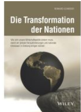
Die Transformation der Nationen Ladenpreis: 41,20EUR