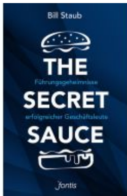
The Secret Sauce Ladenpreis: 20,60EUR

Wir haben andere Produkte gefunden, die Ihnen gefallen könnten!