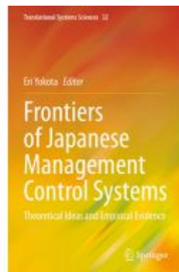
Frontiers of Japanese Management Control Systems Ladenpreis: 164,99EUR