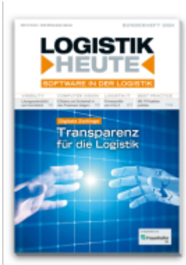
Software in der Logistik 2024 Ladenpreis: 32,80EUR