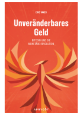
Unveränderbares Geld Ladenpreis: 25,70EUR