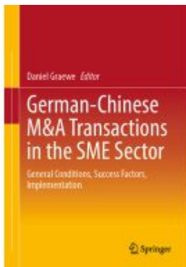
German-Chinese M&A Transactions in the SME Sector Ladenpreis: 71,49EUR