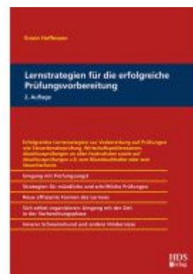
Lernstrategien für die erfolgreiche Prüfungsvorbereitung Ladenpreis: 56,50EUR