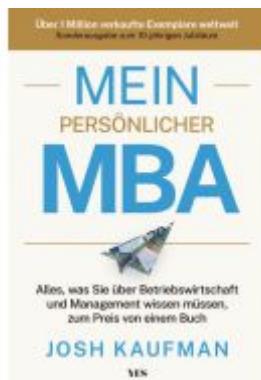
Mein persönlicher MBA Ladenpreis: 30,90EUR