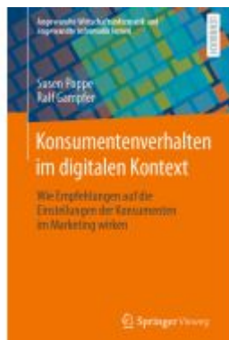
Konsumentenverhalten im digitalen Kontext Ladenpreis: 35,97EUR

Wir haben andere Produkte gefunden, die Ihnen gefallen könnten!