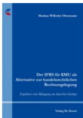
Der IFRS für KMU als Alternative zur handelsrechtlichen Rechnungslegung Ladenpreis: 102,60EUR