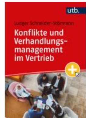
Konflikte und Verhandlungsmanagement im Vertrieb Ladenpreis: 25,60EUR