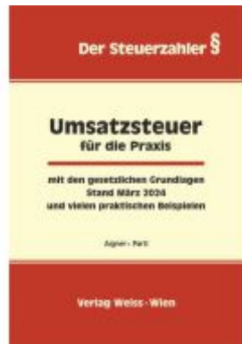
UMSATZSTEUER für die Praxis 2024 Ladenpreis: 64,90EUR