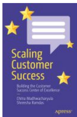
Scaling Customer Success Ladenpreis: 38,49EUR