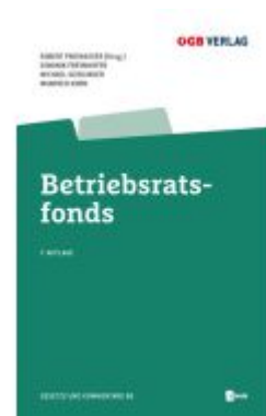
Betriebsratsfonds Ladenpreis: 36,00EUR