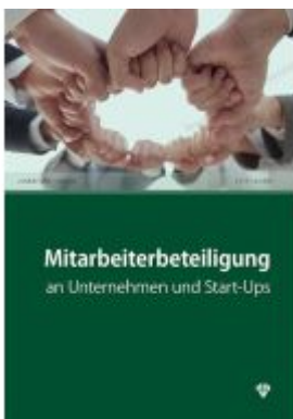
Mitarbeiterbeteiligung Ladenpreis: 24,20EUR