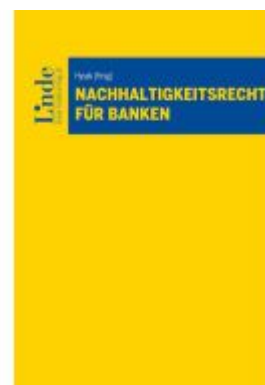
Nachhaltigkeitsrecht für Banken Ladenpreis: 88,00EUR