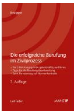
Die erfolgreiche Berufung im Zivilprozess Ladenpreis: 39,00EUR