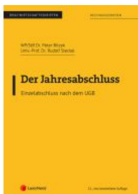
Der Jahresabschluss - Einzelabschluss nach dem UGB Ladenpreis: 22,50EUR