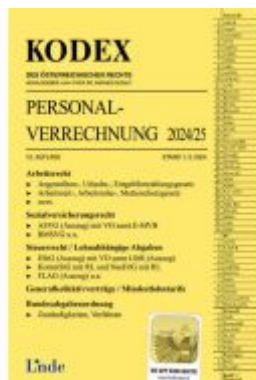
KODEX Personalverrechnung 2024/25 Ladenpreis: 45,00EUR