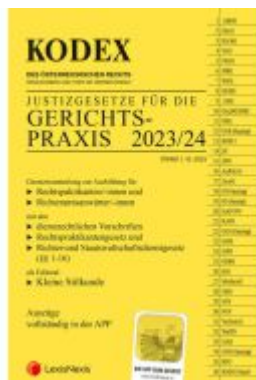
KODEX Gerichtspraxis 2023/24 - inkl. App Ladenpreis: 24,00EUR

Wir haben andere Produkte gefunden, die Ihnen gefallen könnten!