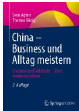
China – Business und Alltag meistern Ladenpreis: 46,26EUR