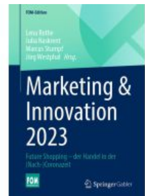
Marketing & Innovation 2023 Ladenpreis: 41,11EUR