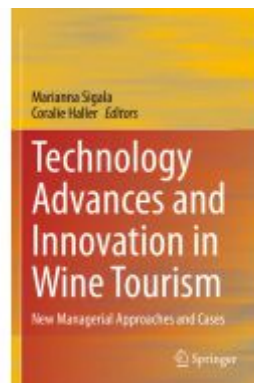
Technology Advances and Innovation in Wine Tourism Ladenpreis: 175,99EUR