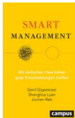
Smart Management Ladenpreis: 50,40EUR