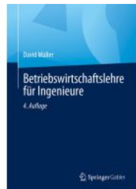
Betriebswirtschaftslehre für Ingenieure