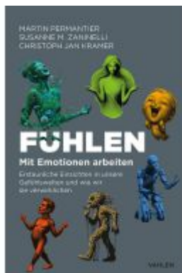
Fühlen. Mit Emotionen arbeiten