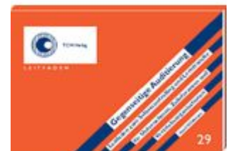
Gegenseitige Auditierung - Einführungsleitfaden Ladenpreis: 250,00EUR