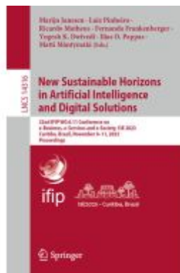
New Sustainable Horizons in Artificial Intelligence and Digital Solutions