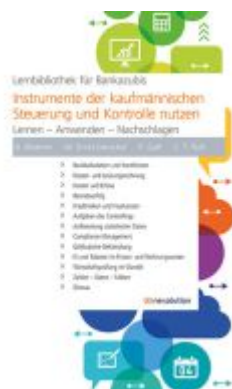
Instrumente der kaufmännischen Steuerung und Kontrolle nutzen