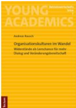
Organisationskulturen im Wandel Ladenpreis: 35,00EUR