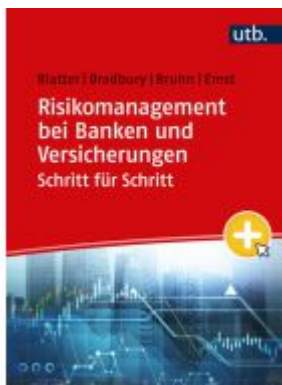
Risikomanagement bei Banken und Versicherungen Schritt für Schritt Ladenpreis: 29,80EUR