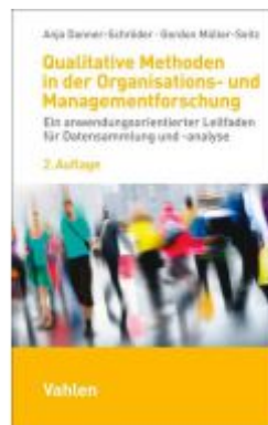
Qualitative Methoden in der Organisations- und Managementforschung Ladenpreis: 19,50EUR