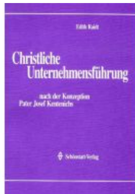
Christliche Unternehmensführung Ladenpreis: 23,70EUR