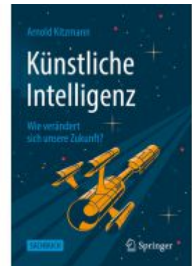
Künstliche Intelligenz Ladenpreis: 33,92EUR