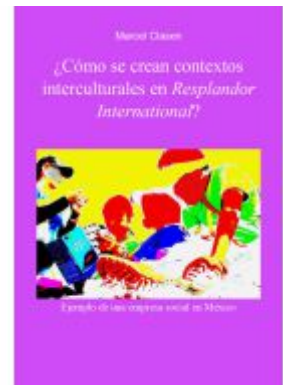
¿Cómo se crean contextos interculturales en Resplandor International? Ladenpreis: 15,50EUR