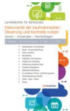
Instrumente der kaufmännischen Steuerung und Kontrolle nutzen Ladenpreis: 28,80EUR