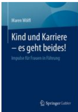
Kind und Karriere – es geht beides! Ladenpreis: 39,05EUR