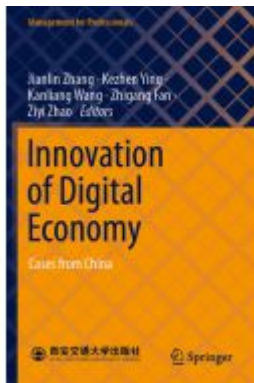
Innovation of Digital Economy Ladenpreis: 76,99EUR