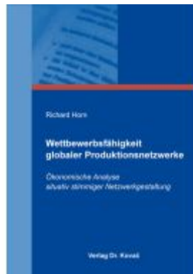
Wettbewerbsfähigkeit globaler Produktionsnetzwerke Ladenpreis: 91,40EUR